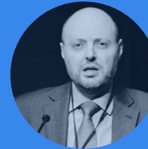
Pietro Calamea Ministero della Salute. Direzione generale dei Dispositivi Medici e del Servizio Farmaceutico.