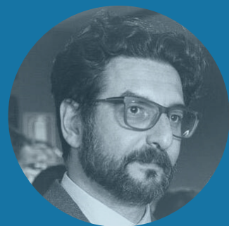
Luca Nave Filosofo e Bioeticista Clinico. Rete interregionale per le malattie rare delle Regioni Piemonte e Valle D'Aosta